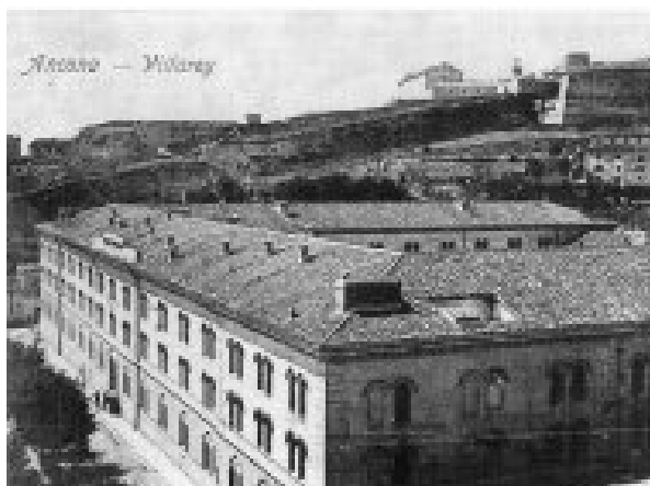
La Facoltà di Economia di Ancona

http://www.econ.unian.it/strutture/dipecon/